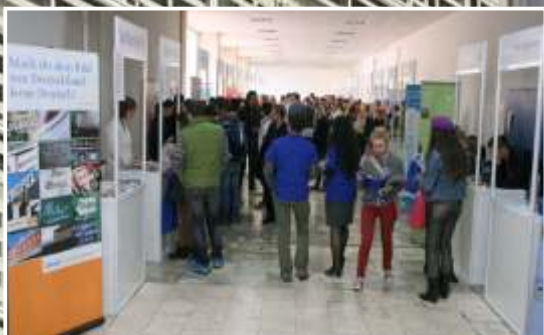
TRE I SAJAM STIPENDIJA THE THIRD SCHOLARSHIP FAIR 2012