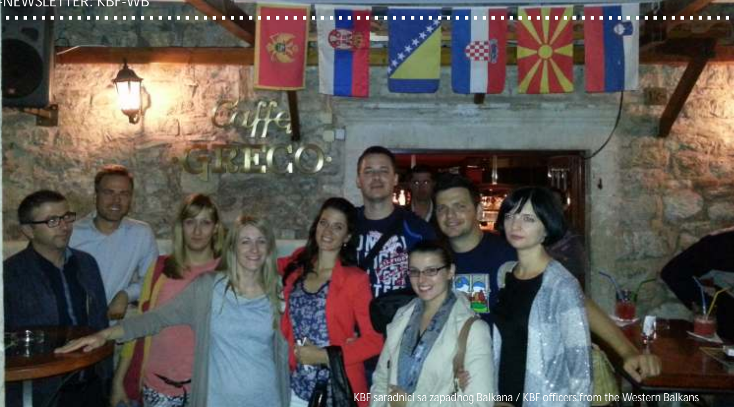
KBF saradnici sa zapadnog Balkana / KBF officers from the Western Balkans