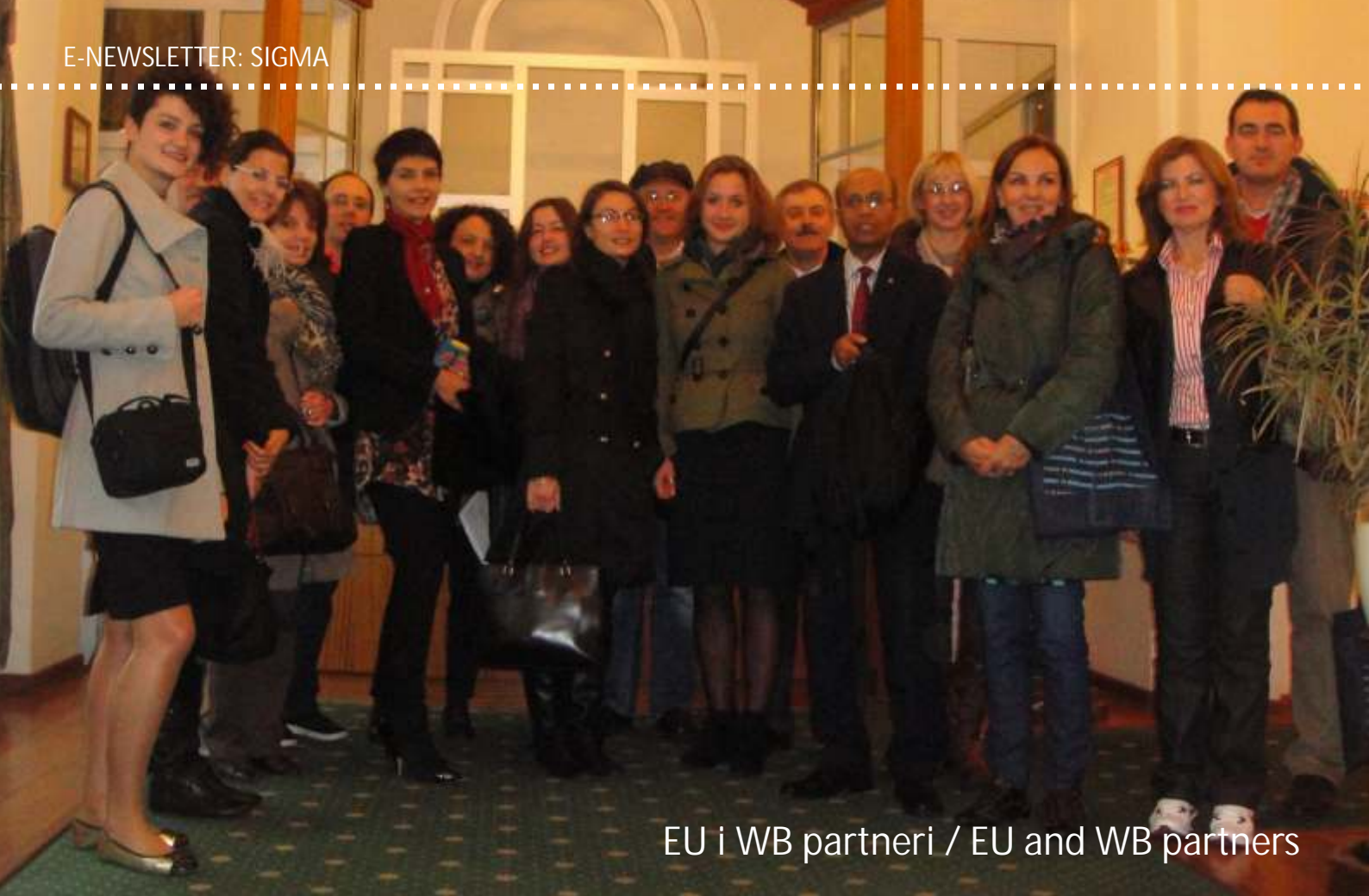
EU i WB partneri / EU and WB partners