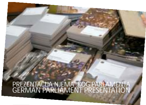
PREZENTACIJA NJEMA KOG PARLAMENTA GERMAN PARLIAMENT PRESENTATION