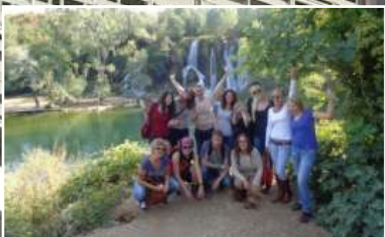
DOBRODOŠLI STUDENTI! WELCOME EXCHANGE STUDENTS!